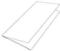
manuál / manuál